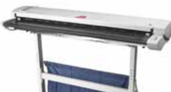
EyeC Proofer 900 - 1100 CS