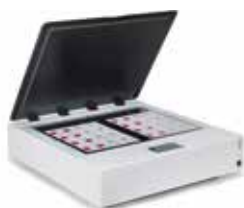
EyeC Proofer 400 - 600 DT