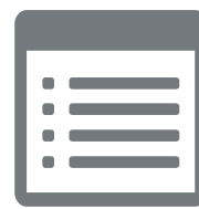
監査証跡ビューフ