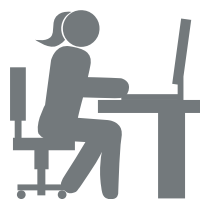
レビューステーション