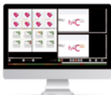
EyeC Proofer Content