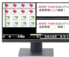
EyeC Proofer Graphic