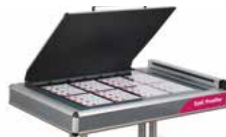
EyeC Proofer 900 - 1200 DT