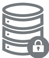
安全なデータベース